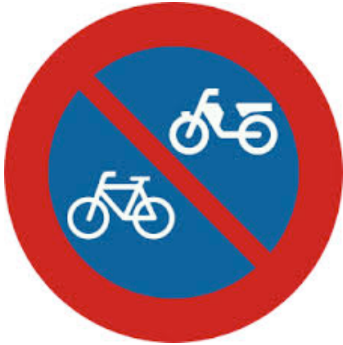
Verboden fietsen te plaatsen.